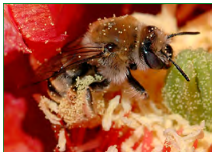
Опылители астрофитумов: Diadasia .

A.myriostigma v.potosinum примерно восьмилетнего возраста имели всхожесть 20%. Но дольше всего, по нашим данным, сохраняют всхожесть A.senile : если семилетние семена имели 100% всхожесть, то семена десятилетнего возраста — 75%.