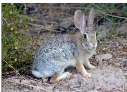
Вредители астрофитумов: Sylvilagus audubonii .

Вредители астрофитумов: личинка Moneilema armatum .