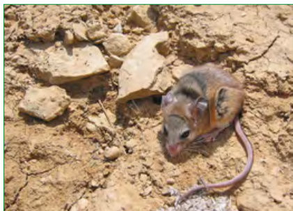
Вредители астрофитумов: Peromyscus eremicus .