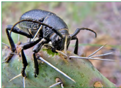
Вредители астрофитумов: Moneilema armatum .