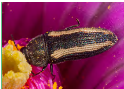
Опылители астрофитумов: Acmaeodera cazieri .