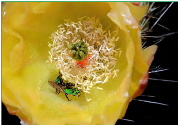
Опылители астрофитумов: Augochloropsis metallica .

Немногие ученые и любители изучали долговечность семян кактусов, в том числе астрофитумов. Поэтому было приятно познакомиться с работой группы мексиканских ученых, которые изучали всхожесть семян A.coahuilense (в статье называется A.myriostigma ), собранных ими в природе в 2001г и хранившихся в бумажных пакетиках при комнатной температуре 4 года. Более того, эти семена